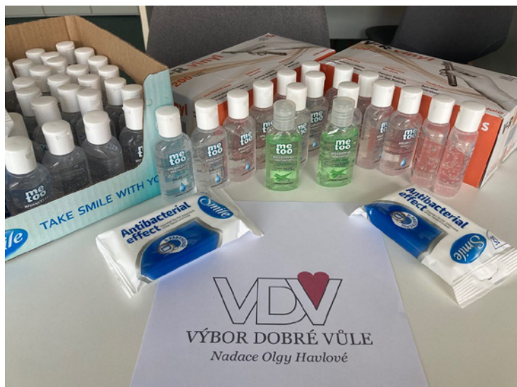
Děkujeme VDV za podporu!